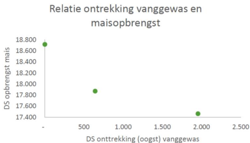
Figuur 1. Onttrekking vs. opbrengst